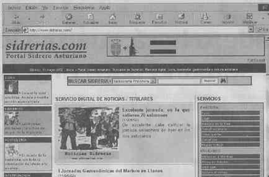
►► Pantalla de acceso al dominio sidrerias.com.