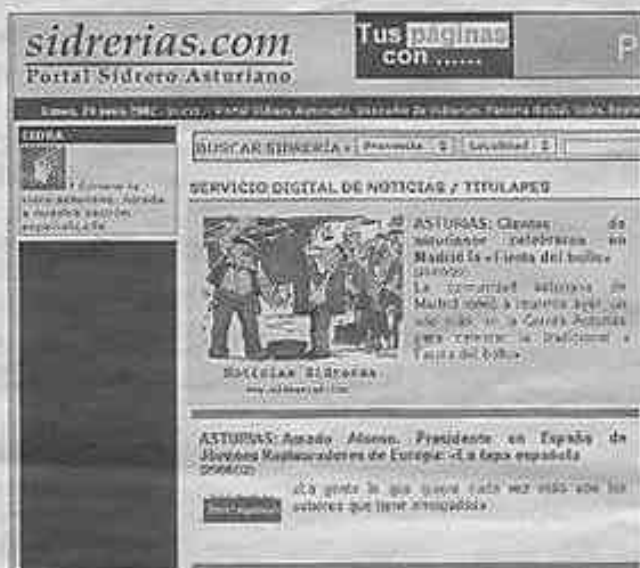
Página principal del primer portal dedicado a la bebida regional.

De una referencia particular sobre cada lugar asturiano en activo a recetas gastronómicas con la sidra como principal ingrediente. Todo ello, aderezado además con diversos recursos generales sobre la región, hace de este portal una referencia imprescindible para quienes desde cualquier parte del mundo quieran estar al tanto de la actualidad sidrera.